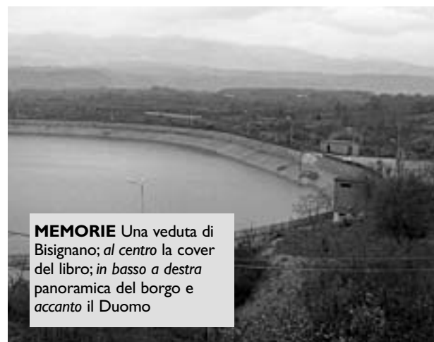
MEMORIE Una veduta di Bisignano; al centro la cover del libro; in basso a destra panoramica del borgo e accanto il Duomo

Rosario Curia (Bisignano, 22 maggio 1922 ? Cosenza, 28 settembre 1995). Bisignanese, insegnante, musicista, direttore del comitato Unesco per la lotta contro l'analfabetismo negli anni dal 1945 al 1947; consigliere comunale di Bisignano dal 1956 al 1964; socio fondatore dell'Istituto storico di Calabria; autore di musica e versi; collaboratore per la sezione storico-letteraria delle riviste "Nuova Rassegna", "Il Letterato" e varie; benemerita del ministro della pubblica istruzione, per l'opera educativa svolta; premio della cultura della presidenza del consiglio dei ministri per il 1986. Ha pubblicato: Orientamenti Didattici , Cosenza, Biondi, 1971; Mendicino (sito dell'antica Pandosia del Bruzio) , Cosenza, Effesette, 1981; Bisignano nella storia del Mezzogiorno (dalle origini al XIX sec.) , Cosenza, Pellegrini Editore, 1985; I Bisignano (ceppo nobiliare della Città omonima) , Cosenza, Grafica Cosentina, 1992; Cronotassi dei Vescovi della Diocesi di Bisignano (a.d. 744-1990) , Cosenza, Pellegrini Editore, 1992; I fratelli De Bonis e la liuteria in Bisignano , Cosenza, De Rose, 1994, Edizione fuori commercio della Cassa Rurale ed Artigiana di Bisignano; Tradizioni popolari in Bisignano , Cosenza, Pellegrini Editore, 1994; I Sanseverino Principi di Bisignano , Cosenza, Pellegrini Editore, 1997.